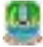
Tabel 2.2.1 Perjanjian Kinerja Kecamatan Pondokgede Tahun 2023